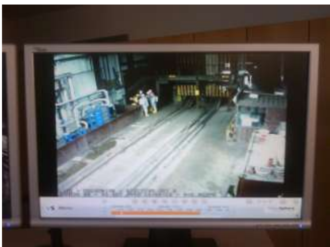
Spremljanje poteka vaje reševanja v nadzornem centru (reševalna četa Rudnika živega srebra Idrija)