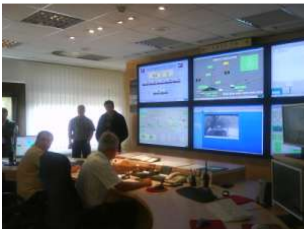
Nadzorni center Premogovnika Velenja in štab vaje reševanja