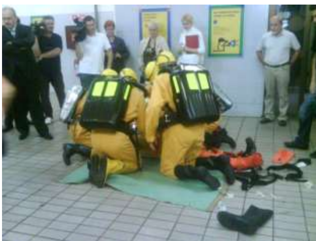
Prikaz reševanja in nudenja prve pomoči ponesrečencu (reševalna četa Premogovnika Velenje)