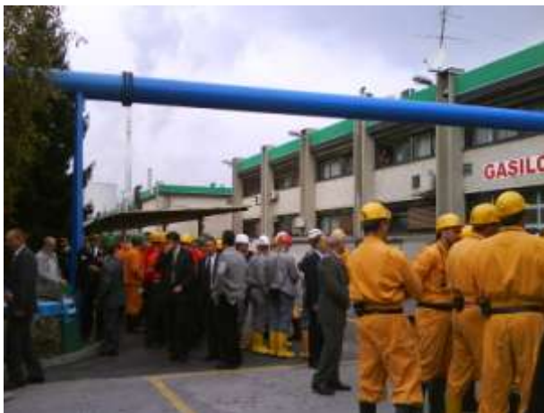
Zbor rudarskih reševalnih čet rudnikov Slovenije v Premogovniku Velenje

Rudarski reševalci Rudnika živega srebra Idrija so se v petek 9. oktobra 2009 udeležili republiške reševalne vaje v Premogovniku Velenje. V vaji so sodelovale reševalne ekipe iz Premogovnika Velenje, Rudnika Trbovlje – Hrastnik, Idrije, Nafta Lendava ter operativne gasilske enote (ekipe gasilcev PIGD Premogovnika Velenje in PGD Velenje). Namen izvedbe skupne reševalne vaje je bil preizkusiti strokovno usposobljenost rudarskih reševalnih čet za reševanje v primeru rudniške nesreče v sodelovanju z interventnimi gasilskimi enotami. Predpostavka vaje reševanja je bilo razlitje in vžig nafte na ranžirni postaji za transport materiala pred jaškom NOP na območju Premogovnika Velenje. Ekipe gasilcev so izvedle gašenje in aktivnosti na površini, v jami pa so sodelovale ekipe rudarskih jamskih reševalcev. Reševalna vaja spada v sklop skupnih republiških reševalnih vaj, ki se izvajajo enkrat letno v različnih rudarskih organizacijah. Reševalna služba Premogovnika Velenje šteje 104 člane, Rudnika Trbovlje – Hrastnik 60 članov, Nafta Lendava 15 članov, Idrija 7 in Mežica 5 članov. Ogleda vaje se je udeležila tudi ministrica za obrambo dr. Ljubica Jelušič.